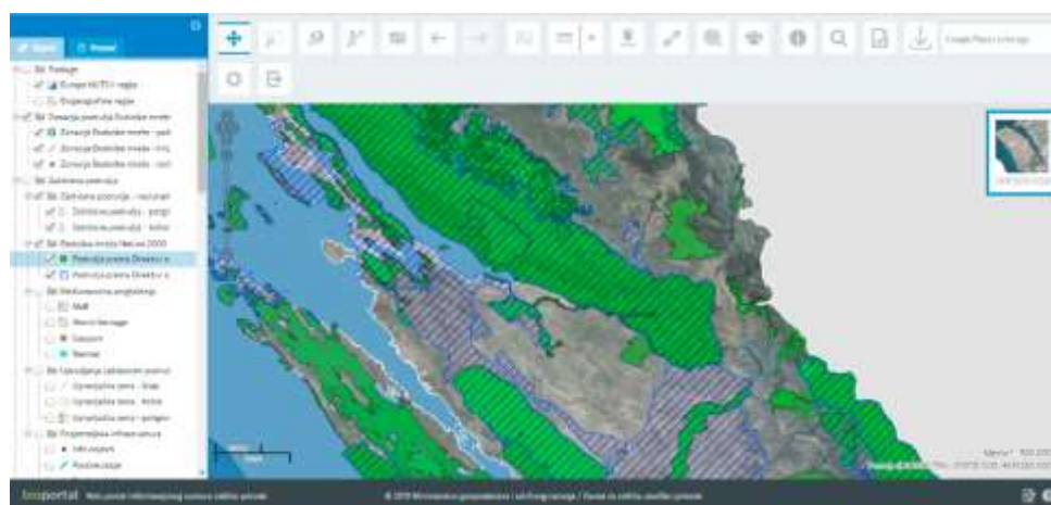
Slika 3: Ekološka mreža Natura 2000 na području LAG-a