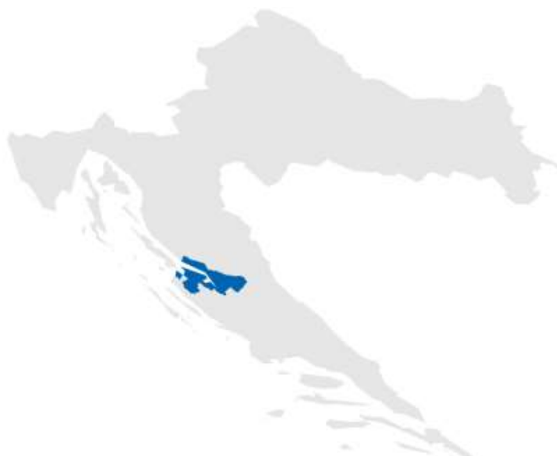
Slika 2: Karta položaja LAG-a na karti Republike Hrvatske