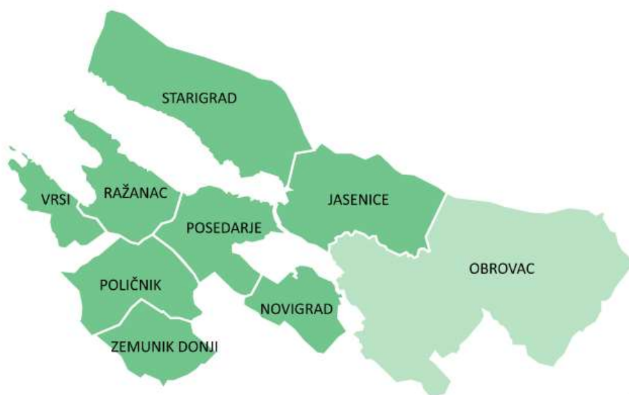
Slika 1. Karta LAG područja s vidljivim granicama JLS-ova u LAG-u